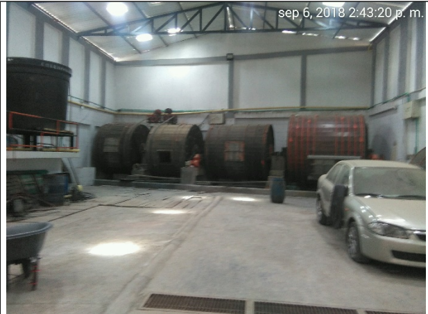
Foto No. 2 Implementación de sistema de tratamiento. Usuario sin actividad o proceso actualmente.