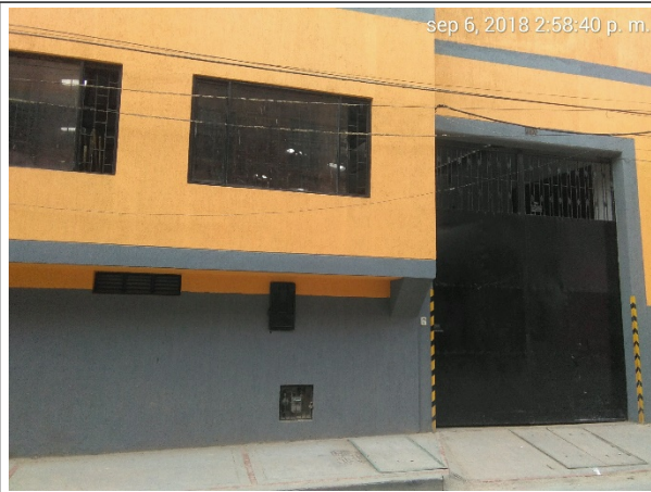
Foto No. 1 Fachada del establecimiento INVERSIONES Y MANUFACTURAS FONAYA SAS